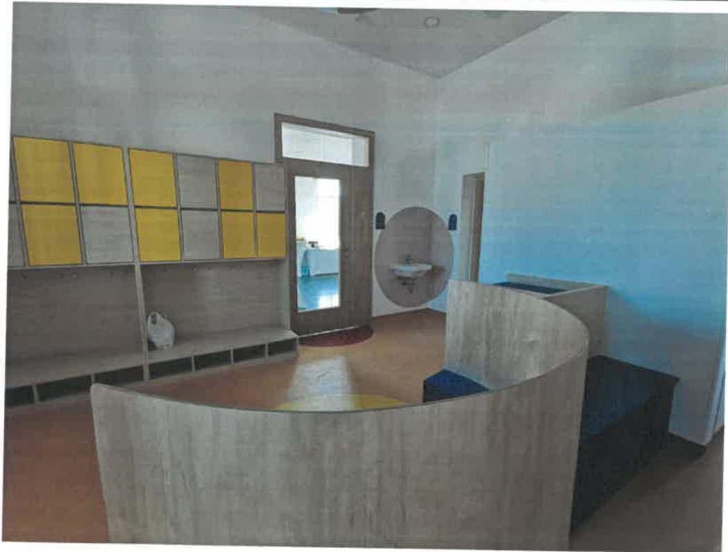
Gyermeköltöző a Kánya Villában