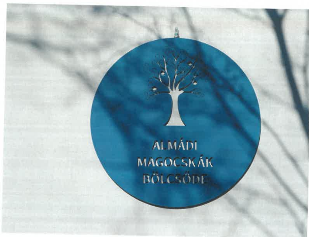
Intézményünk logója, a főbejáratnál