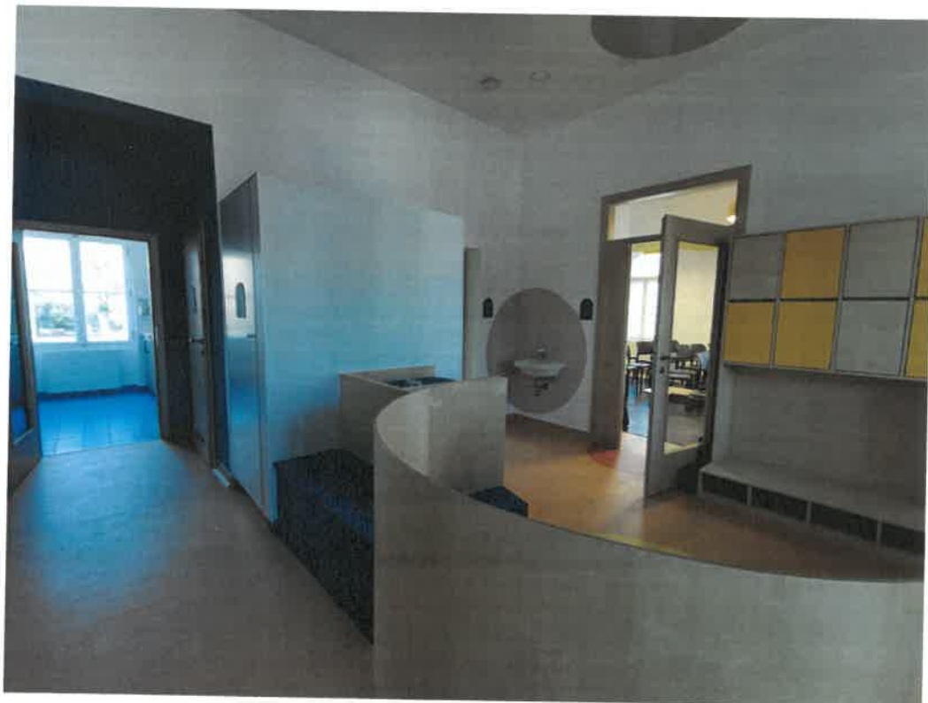
Gyermeköltöző a Kánya Villában