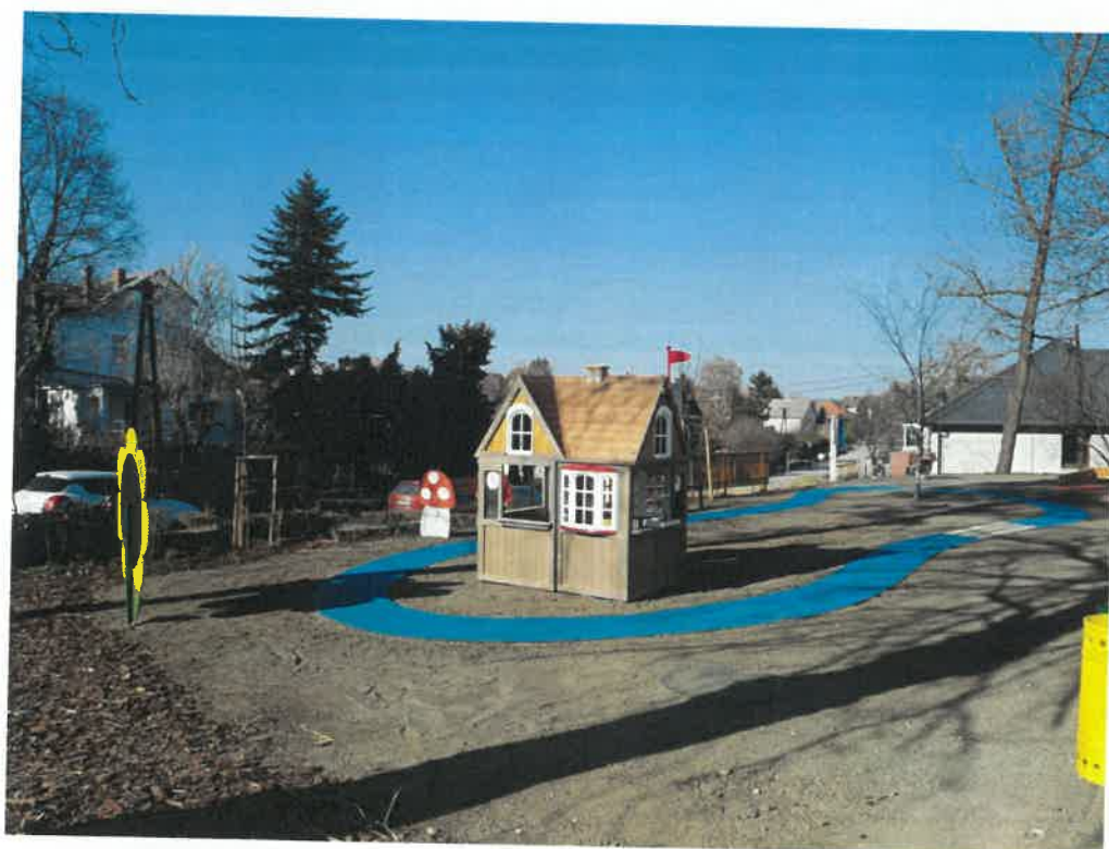
Az egyik udvari játszóegységünk